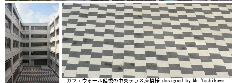
カフェウォール錯視の中央テラス床模様 designed by Mr. Yoshikawa